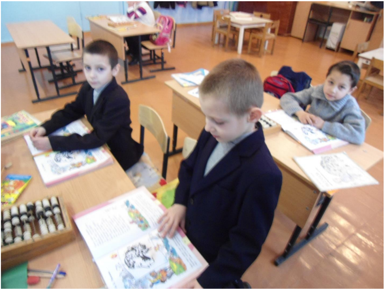
Игра «Найди своё место»