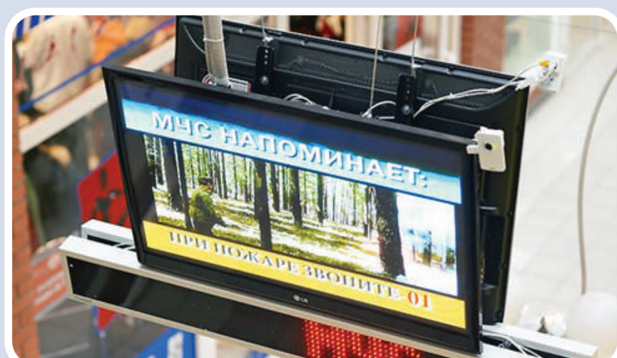
Пункт информирования и оповещения населения в зданиях с массовым пребыванием людей