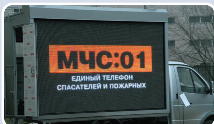
Мобильный комплекс информирования и оповещения населения