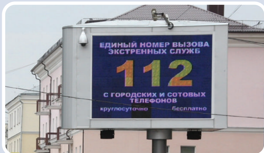
Пункт уличного информирования и оповещения населения